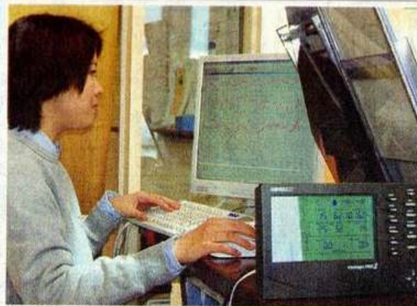
認定されたアップデータ社が開発し、統合管理ソフトウェアを導入する気象観測システム

「ヨットオーナーたち の声も集約させた総合的 なソフトウェア」と同 社。ソフトウェアは7月上旬に